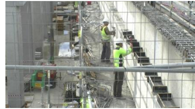
3. Son _____