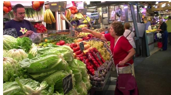
5. Es _____