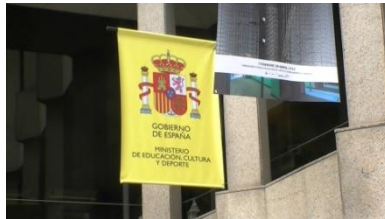
5. Son _____