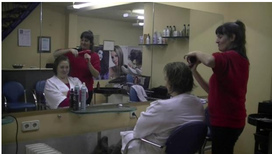
4. Es _____