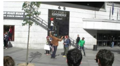
9. Es _____