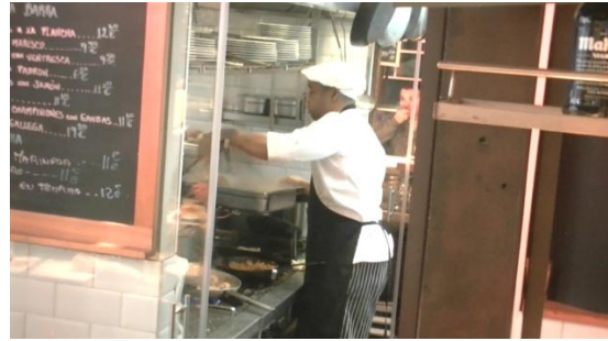
2. Es _____