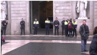
4. Son _____