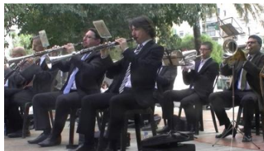
8. Son _____