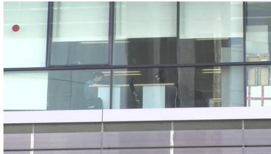
3. Es _____