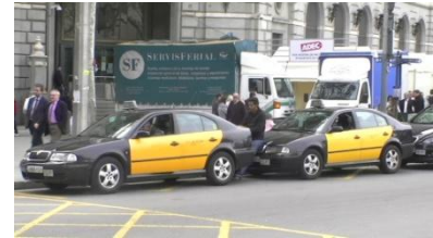
3. Son _____