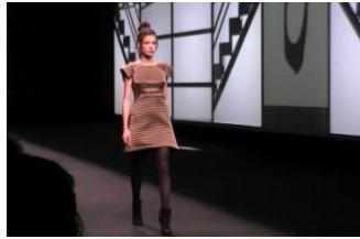
2. Es _____