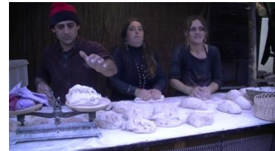
6. Son _____