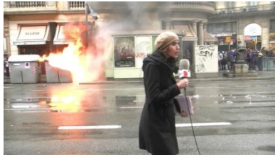
1. Es _____

taxistas • panaderos • cantantes funcionarios • reportera • músicos piloto • estudiantes • maestra