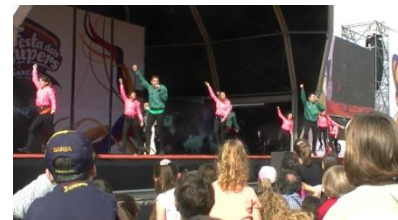
9. Son _____