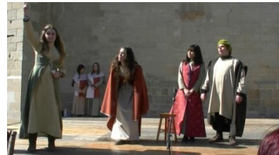
6. Son _____