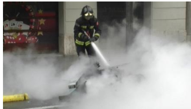
5. Son _____