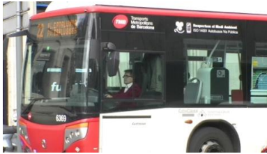
1. Es _____