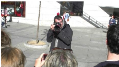
7. Es _____