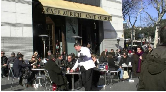
1. Es _____

administrativo • vendedor • médico estilista • mesero • cocinero