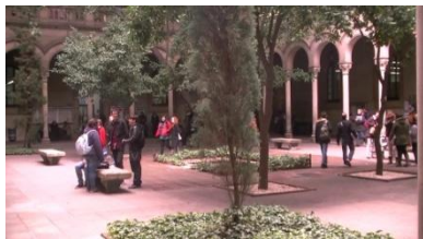
4. Son _____