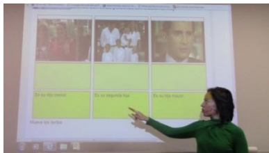
7. Es _____