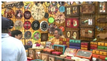
8. Es _____