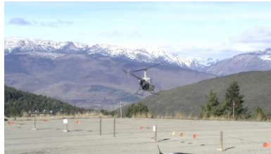
2. Es _____