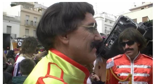
6. Van disfrazados de...