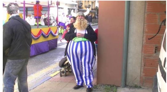
2. Va disfrazado de...