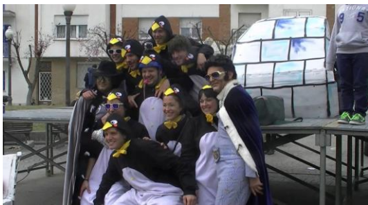
3. Van disfrazados de...