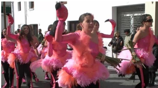
1. Van disfrazadas de...