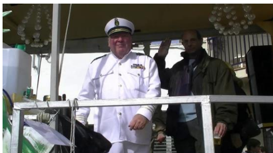
5. Va disfrazado de...