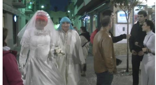
4. Va disfrazado de...