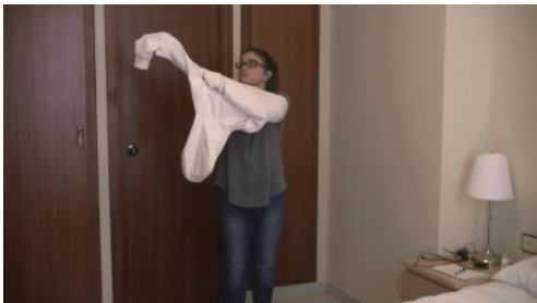
3. Viste / Se viste .