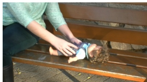
8. Se acuesta / Acuesta a la muñeca.