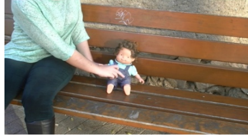
2. Sienta / Se sienta a la muñeca.