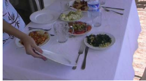
2. La chica _____ la mesa.