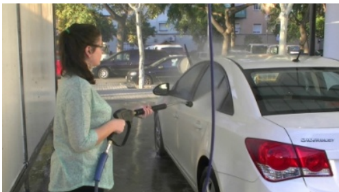
3. _____ el coche.