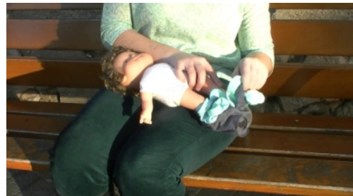
4. Viste / Se viste a la muñeca.