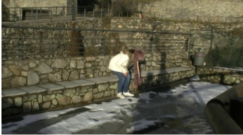
1. Sienta / Se sienta en el parque.