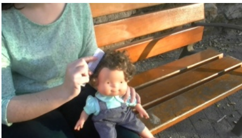
5. Se peina / Peina a la muñeca.