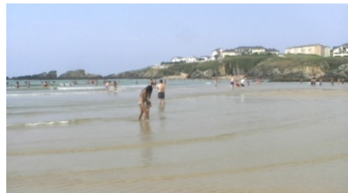
8. _____ en la playa.