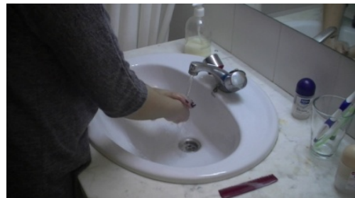
4. _____ las manos.