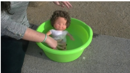
7. _____ a la muñeca.