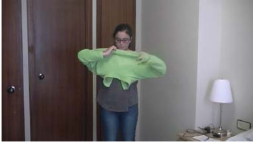
1. La chica _____ la ropa.

se pone • se lava • pone • baña levanta • se bañan • se levanta • lava