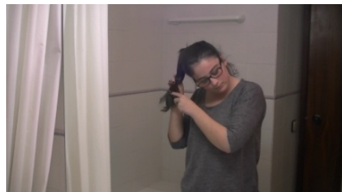
6. Se peina / Peina .